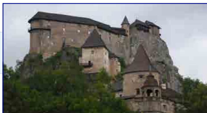
Château d'Orava - Slovaquie